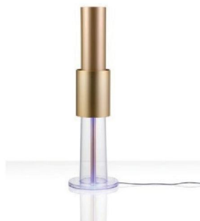
LifeAIR Modèle EVOLUTION

Évitez les tapis, moquettes et autres dans les chambres à coucher et si vous avez des allergies, supprimez-les de la maison.