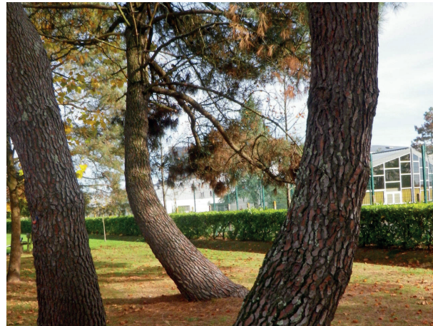
■ Une des manifestations dues aux énergies du réseau Hartmann, les arbres tordus

En 1961, il fonda un Centre de recherche pour la « géobio-