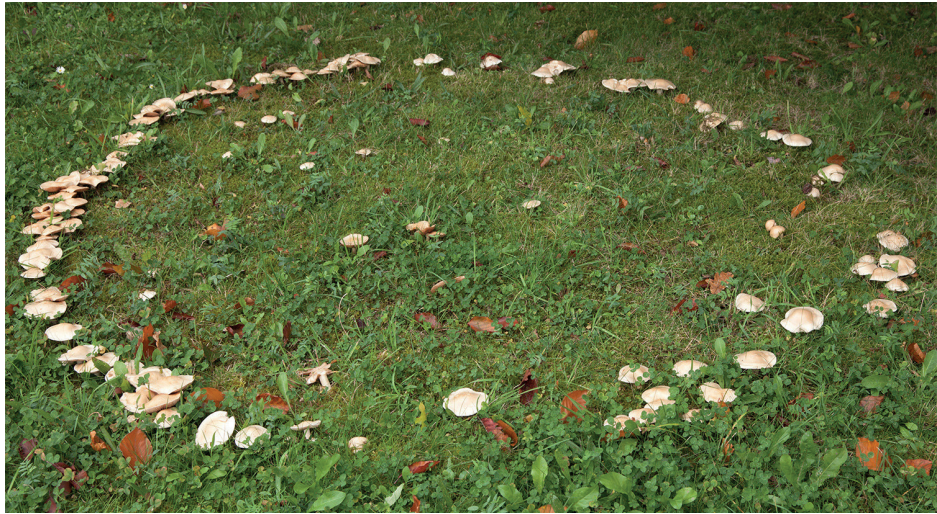
Une manifestation dans la nature

Les vortex sont les phénomènes les plus puissants répertoriés jusqu'à ce jour par les géobiologues. Ils sont utilisés depuis la nuit des temps. Appartenant au monde éthérique, ils sont bien évidemment invisibles, et ne sont données ici que leur forme et leur explication au niveau géobiologique.